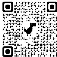
塚越相談室案内2次元コード