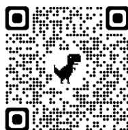
溝口相談室案内2次元コード